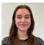
Vera Boekema St. Martinusschool Op Weg Titus Brandsma Adelbrecht Windekind SBO Carolusschool Kindcentrum Op de Horst